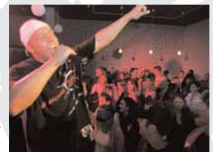
Beim RAP-Konzert im Kunstverein