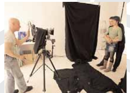
Fotoaktion im Fotografie Forum

Der erste Auftritt der UN-Kampagne bei der Nacht der Museen war ein voller Erfolg, deshalb sind weitere Events in anderen Städten schon auf dem Plan des UN-Teams.