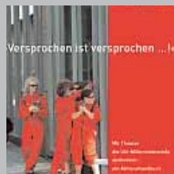
Theaterhandbuch „Versprochen ist versprochen ...“

Das gemeinsam mit der UN-Millenniumkampagne und dem DED entwickelte Handbuch beschreibt lebendig und praxisnah Theateraktionen, die die MDGs kreativ ins Bewusstsein der Öffentlichkeit rücken.